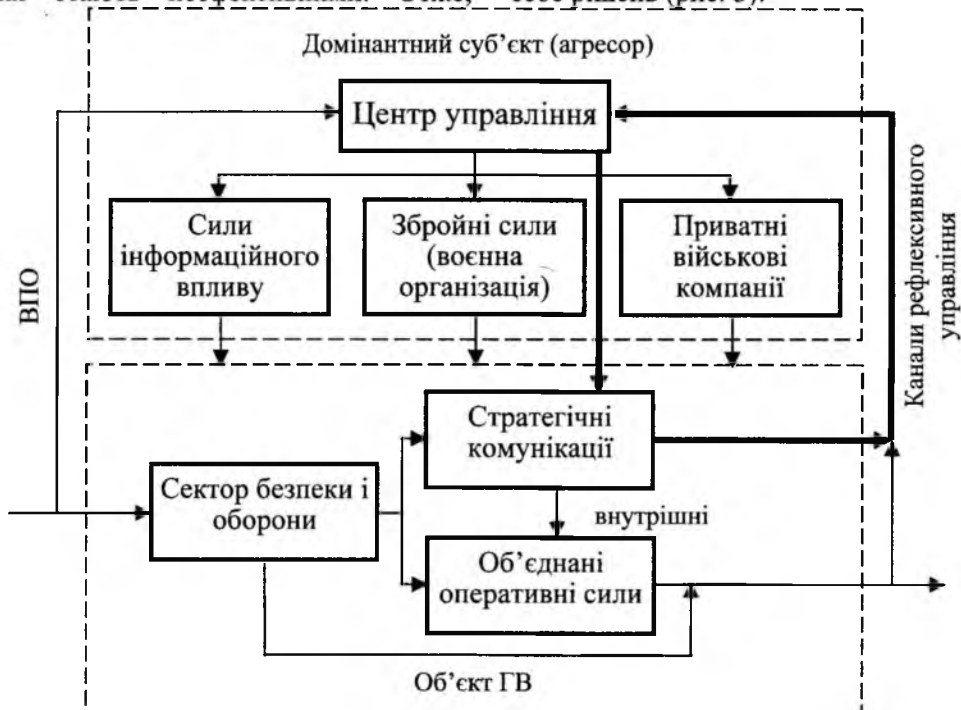
Рис. 3. Застосування рефлексивного управління в стратегічних комунікаціях для протидії загрозам гібридного характеру

Рефлексивне управління, засноване на теоретичних розробках В. Лефевра [15,16], обґрунтовує результативне використання комплексних інструментів, що дають змогу впливати на прийняття противником вигідних іншій стороні рішень внаслідок створення певних ситуацій або демонстрації потенційних загроз. За визначенням В. Лефевра, рефлексивне управління - це "процес, у якому один зі супротивників передає іншому підстави для прийняття рішень". Іншими словами, через комунікації зворотного зв'язку відбувається підміна факторів мотивації противника для спонукання його на прийняття не вигідних для себе рішень (рис. 3).